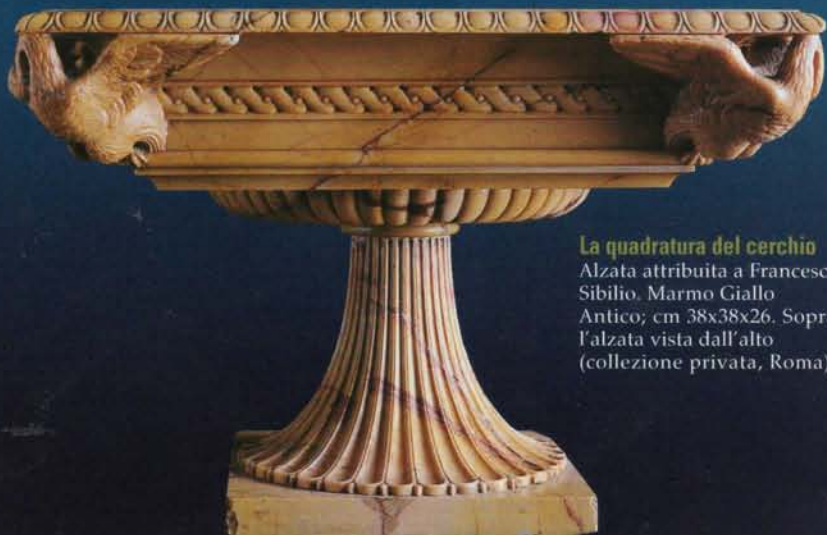
La quadratura del cerchio Alzata attribuita a Francesco Sibilio. Marmo Giallo Antico; cm 38x38x26. Sopra, l'alzata vista dall'alto (collezione privata, Roma).