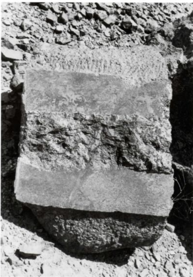
3. Parete della cava del «granito della colonna». Umm Shegilat, Egitto