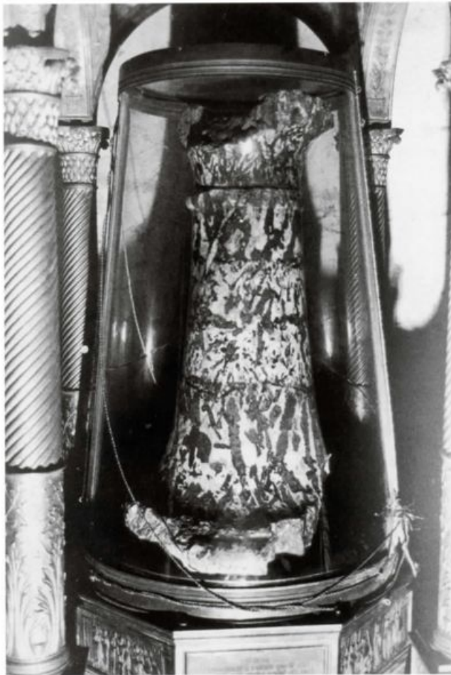
2. La Colonna della Flagellazione. Roma, Santa Prassede

di qualità differente alla pasta interna (figg. 3-4).